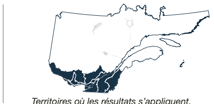
Territoires où les résultats s'appliquent.

Plusieurs études ont montré que le chaulage est un traitement sylvicole efficace pour corriger des problèmes de vigueur de l'érable à sucre dans les érablières dont le sol est acide et peu fertile. Les produits utilisés lors de ces études sont principalement la chaux dolomitique ( \text{CaMg}(\text{CO}_3)_2 ) et la chaux calcaire ( \text{CaCO}_3 ). Récemment, des fertilisants liquides à base de nitrate de calcium ( \text{Ca}(\text{NO}_3)_2 ) ont fait leur apparition sur le marché pour fertiliser les érablières, bien qu'aucune étude, à notre connaissance, n'ait été publiée à leur sujet. L'analyse de la dose prescrite par des fournisseurs et un calcul d'équivalence permettent de conclure que ces fertilisants ne peuvent se substituer à la chaux conventionnelle. En effet, ils n'ajoutent que très peu d'éléments actifs au sol. D'autres produits liquides ayant de faibles concentrations d'éléments actifs sont également offerts sur le marché. Peu importe le produit utilisé, il est recommandé de faire évaluer l'état nutritionnel de son érablière par un ingénieur forestier avant d'entreprendre des travaux d'amendements et de s'assurer que le produit envisagé puisse répondre au besoin de son érablière, le cas échéant.