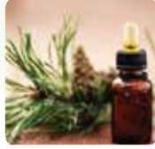
Produits manufacturés et matériaux