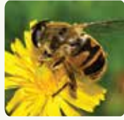
Installation de ruches