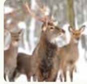
Cerf de Virginie