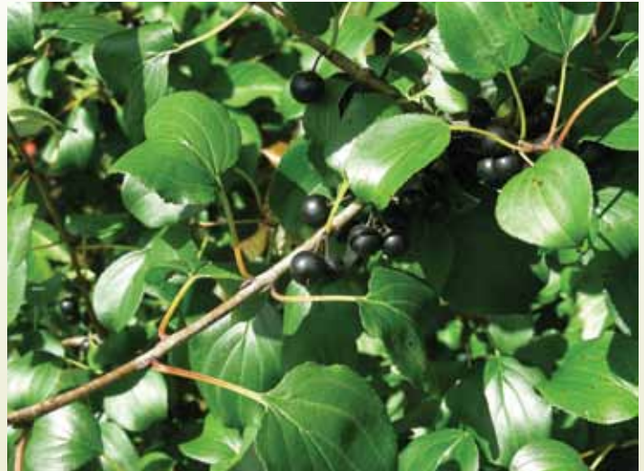
Les feuilles du nerprun cathartique sont à peine plus longues que larges, plus larges à la base qu'au sommet, comptent seulement 3 grosses nervures latérales (de chaque côté de la nervure centrale), et leur marge est dentelée.

du Saint-Laurent, particulièrement sur l'Île de Montréal. Toutefois, le nerprun cathartique n'a été recensé dans aucune des 30 parcelles forestières que nous avons échantillonnées dans les Cantons-de-l'Est.