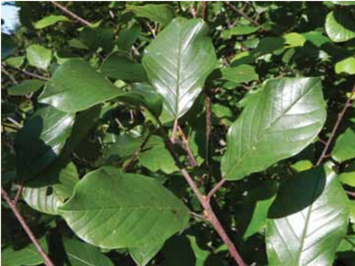
Les feuilles du nerprun bourdaine sont environ deux fois plus longues que larges, plus larges au sommet qu'à la base, comptent au moins 6 grosses nervures latérales (de chaque côté de la nervure centrale), et leur marge est entière.