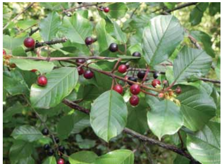
Les rameaux de nerprun bourdaine portent souvent en même temps des fleurs et de nombreux fruits à divers stades de mûrissement.

l'ombre. En comparaison, le nerprun cathartique ( Rhamnus cathartica ), autre envahisseur du même genre, préfère les sols alcalins et il semble très peu tolérant à l'ombre. Ce dernier est très commun dans la plaine