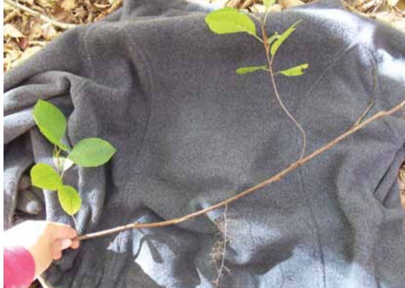
Le marcottage, un moyen de multiplication végétative du nerprun bourdaine.

Les résultats obtenus révèlent une grande variabilité au niveau des caractéristiques des différents sites. Par exemple, les sites se situaient entre 165 et 367 m d'altitude, pouvaient contenir jusqu'à 43 espèces de plantes herbacées ou d'arbustes et affichaient des valeurs de pH entre 3,6 et 6,5. De plus, sur les 30 parcelles, 15 espèces d'arbres étaient dominantes en termes de nombre de tiges, celles-ci présentant une