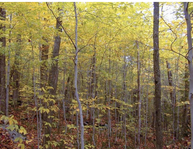
Cohorte de jeunes tiges de hêtre dans une érablière.

les érablières étudiées, il y a dix ans (Figure 1). Toutefois, les données récoltées dix ans plus tard nous révèlent qu'une cohorte 3 de jeunes tiges de hêtre s'est établie, ce qui a provoqué un déséquilibre de la structure inéquienne de ces forêts.