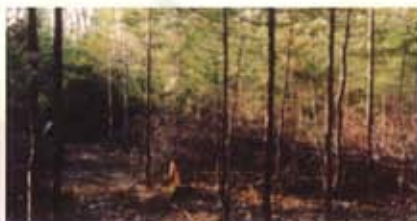
Éclaircie précommerciale réalisée dans une jeune forêt de résineux.

Des tableaux déterminant les distances à conserver entre chaque arbre d'avenir peuvent vous aider lors de l'éclaircie. Ces distances varient selon les espèces d'arbres. Les résineux doivent être éclaircis en coupant tout ce qui pousse dans un rayon de 1 mètre (3,3 pi) autour de la tige.