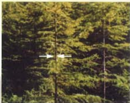
Pour réaliser une éclaircie précommerciale, le diamètre moyen des arbres doit être inférieur à 10 centimètres (4 po) et leur hauteur, environ supérieure à 2 mètres (6,5 pi).

Avant d'être éclairci, le peuplement doit contenir un minimum de 5 000 tiges à l'hectare (2 000 tiges/acre). De plus, le diamètre moyen des tiges doit être inférieur à 10 centimètres (4 po) et leur hauteur, environ supérieure à 2 mètres (6,5 pi).