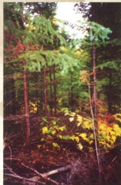
Éclaircie précommerciale réalisée dans une forêt de résineux.

Sylviculture d'un boisé privé , 1989. OPBRQ, CERFO.