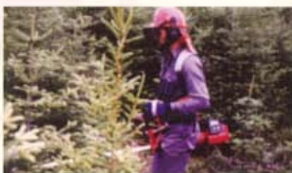
Le respect des règles de sécurité et d'entretien de son outil de travail est essentiel lors des travaux.

Il est important d'être prudent pendant les opérations et de savoir manipuler correctement son outil de travail, car les obstructions étant nombreuses, il est facile de se blesser.