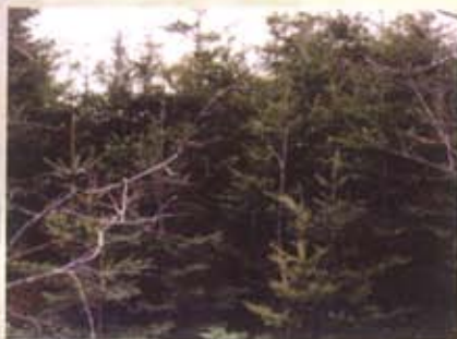
Dans cette forêt de résineux, la lutte entre les arbres pour obtenir l'accès à la lumière et l'espace est très élevée.

L'éclaircie précommerciale est réalisée dans les jeunes forêts âgées généralement de 10 à 20 ans et qui sont trop denses. Une forêt est trop dense lorsque les branches d'arbres voisins s'entrecroisent, de sorte que la compétition pour obtenir l'accès au soleil et à l'air devient beaucoup trop élevée.