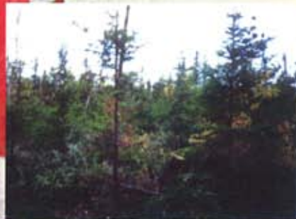
Les arbres coupés lors de l'éclaircie sont laissés au sol.

L'éclaircie précommerciale est une coupe qui permet de réduire la densité des jeunes boisés dont les arbres sont trop serrés. Il s'agit de sélectionner les meilleurs individus, pour ensuite supprimer les arbres voisins pouvant nuire à leur croissance. Donc, au lieu d'attendre que les arbres les plus forts suppriment les plus faibles naturellement, vous choisissez les individus qui composeront votre future forêt et vous coupez les autres. Cette éclaircie est dite précommerciale, car les arbres abattus sont trop petits pour en faire la mise en marché. Ceux-ci sont donc laissés au sol après l'opération.