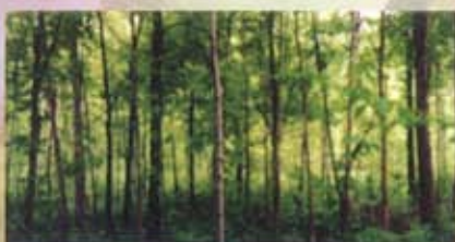
Éclaircie précommerciale réalisée dans une forêt de feuillus.

Quant aux feuillus, il faut également dégager les cimes des arbres d'avenir sur un rayon de 0,5 à 1 mètre (1,6 à 3,3 pi) autour de celle-ci. Toute végétation qui ne nuit pas aux cimes doit être laissée sur pied afin d'éviter qu'il y ait trop de lumière sur les troncs. En effet, plusieurs feuillus